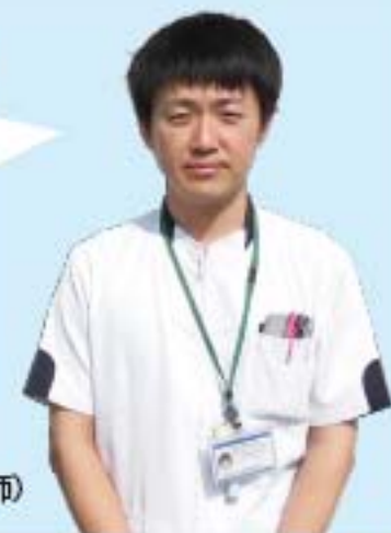
放射線技師(胃がん検診専門技師)

今回は、エックス線検査のご紹介をさせていただきます。バリウム検査でゲップをしない理由や回転の意味を説明します。