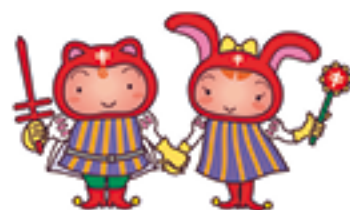
シールぼうやとシールちゃん

複十字シール運動は、結核を中心とした胸の病気をなくして、健康で明るい社会を作るための運動です。その実現のために募金活動を行うとともに、病気への理解を広め、予防の大切さを伝えています。