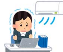
冷房等による 冷え