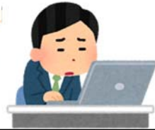
長時間の同じ姿勢